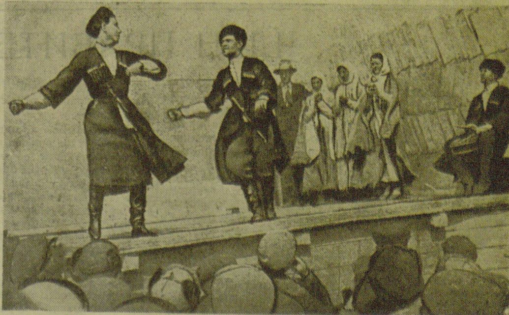
В часы досуга на участке Егорлыкского района. На снимке: выступление черкесского национального ансамбля.

ЛОНДОН, 15 мая. (ТАСС). Агентство Рейтер, ссылаясь на сообщение голландской радиостанции, передает, что сегодня в 5 часов 30 минут утра германские войска вошли в Гаагу.